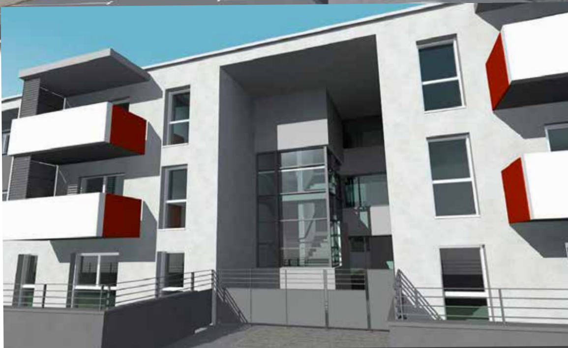
Façade côté avenue de la Paix