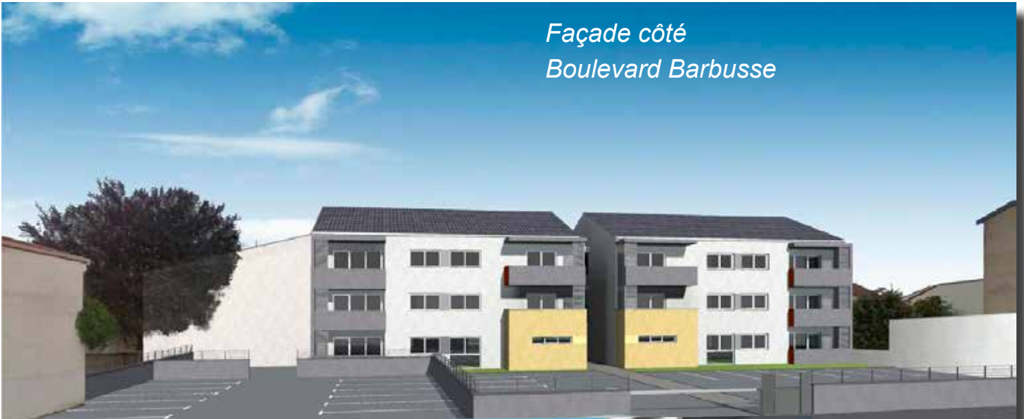
Façade côté Boulevard Barbusse

Après le ravalement des façades des immeubles mmH de l'avenue de la Paix, voilà une nouvelle réalisation qui, à n'en pas douter, apportera un plus esthétique au centre-ville.