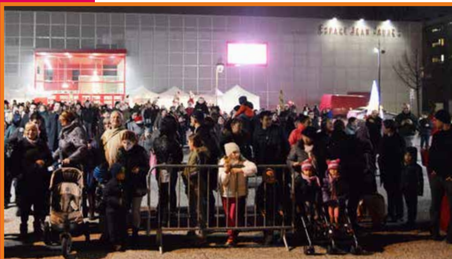
La Place des Arts noire de monde

Toutes les lampes LED sont de type économie d'énergie comme l'ensemble des illuminations de la commune.