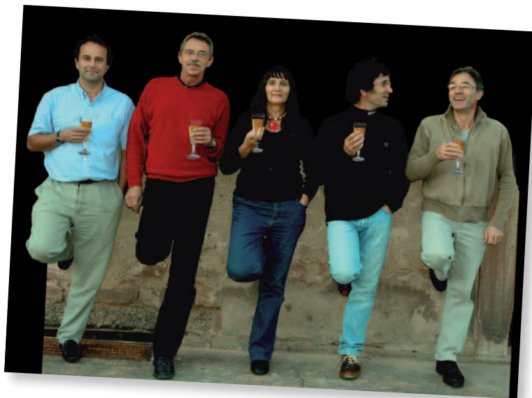
Compagnie « Concurrence Déloyale »

Enfin, la bibliothèque municipale « Edmonde Charles-Roux » propose une exposition « Au square Brassens, j'ai rendez-vous avec vous », du 23 octobre au 26 novembre 2011.