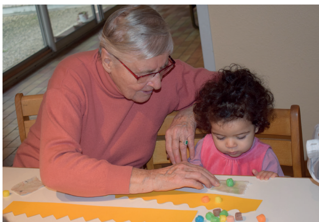
Rencontres intergénérationnelles avec les résidents du Foyer Marcel Grandclerc