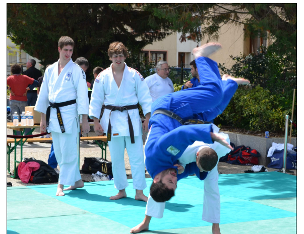
Grande fête des sports conviviale, participative et démonstrative