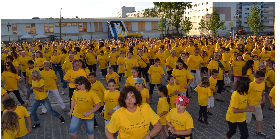
Madison géant réunissant toutes les générations