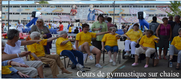
Cours de gymnastique sur chaise