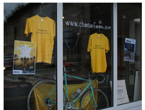
Merci aux commerçants qui ont décoré leurs vitrines