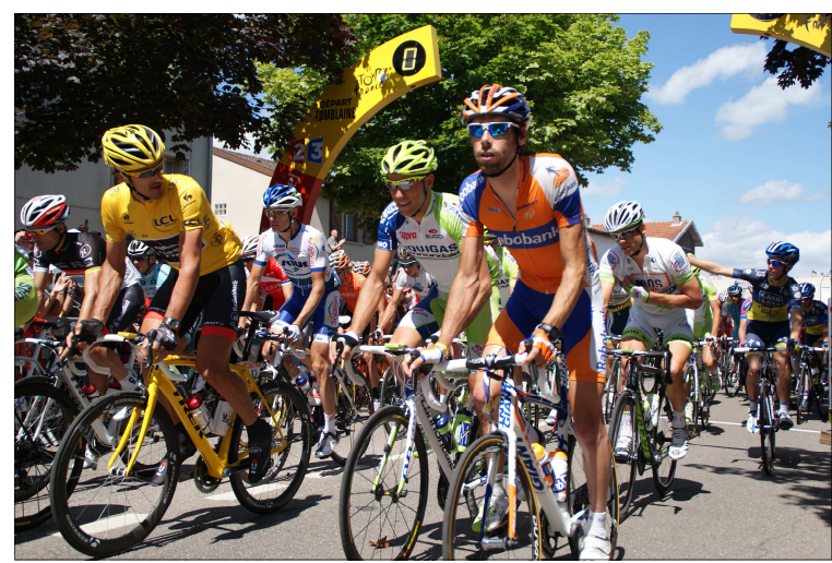
Le départ est donné