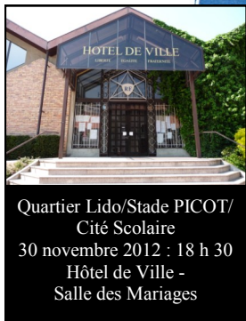
Quartier Lido/Stade PICOT/ Cité Scolaire 30 novembre 2012 : 18 h 30 Hôtel de Ville - Salle des Mariages