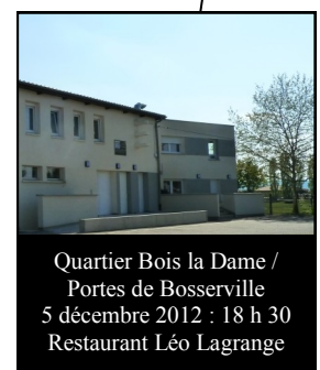
Quartier Bois la Dame / Portes de Bosserville 5 décembre 2012 : 18 h 30 Restaurant Léo Lagrange