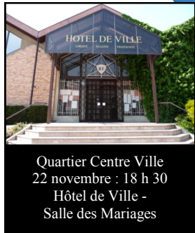
Quartier Centre Ville 22 novembre : 18 h 30 Hôtel de Ville - Salle des Mariages