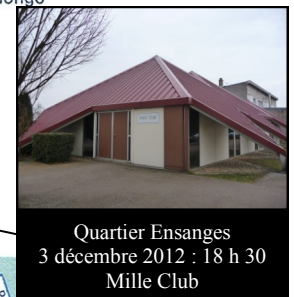
Quartier Ensanges 3 décembre 2012 : 18 h 30 Mille Club