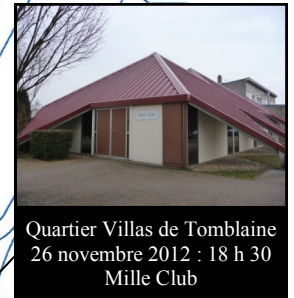
Quartier Villas de Tomblaine 26 novembre 2012 : 18 h 30 Mille Club