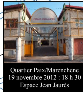
Quartier Paix/Marenchene 19 novembre 2012 : 18 h 30 Espace Jean Jaures