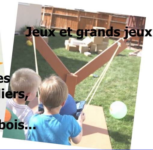
Jeux et grands jeux