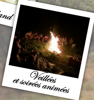
Veillées et soirées animées