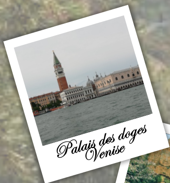
Palais des doges Venise